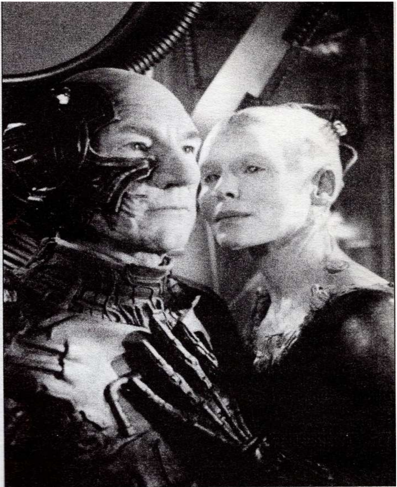
Picard à nouveau aux mains des Borgs, affronte leur reine dans Premier Contact.

• Zephram Cochrane est joué par James Cromwell, Lily Sloane par Woodard, la Reine Borg par Alice Krige et le lieutenant par Neal McDonough. Notons en plus une brève apparition de Robert Picardo, dans le rôle du docteur holographique du médecin virtuel qui est son rôle dans VoyaSchultz reprend son rôle de Reg Barclay, et Ethan Phillips maître d'hôtel parmi les figurants de la séquence ... (joué par Neelix dans Voyager).