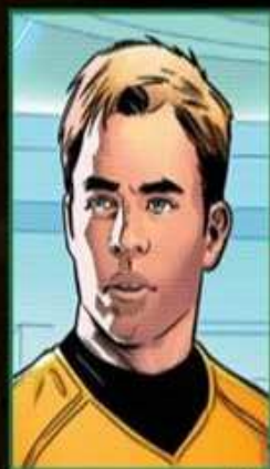
JAMES T. KIRK

Capitaine de l' U.S.S. Enterprise , Vaisseau Amiral de la Fédération.