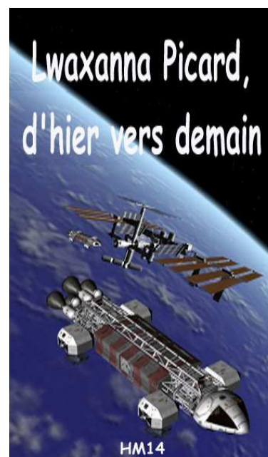
Lwaxanna Picard, d'hier vers demain