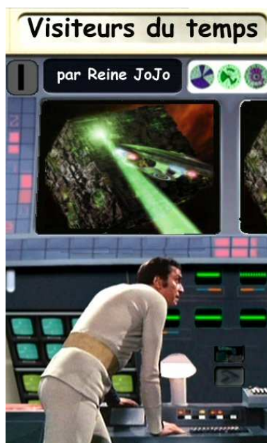
Les visiteurs du temps