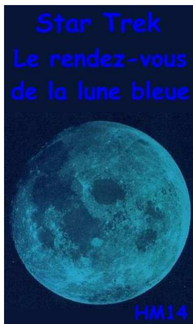
Le rendez-vous de la lune bleue