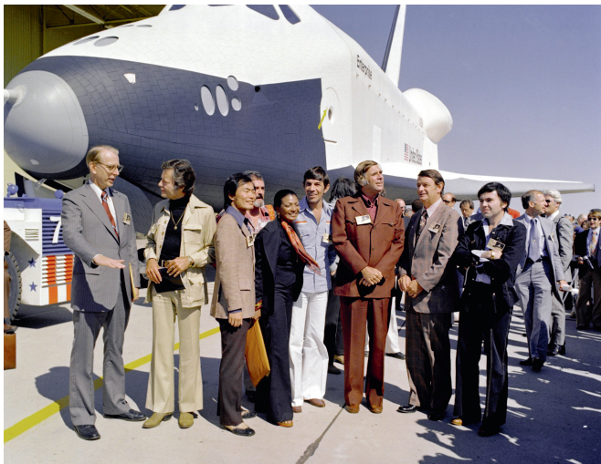
Inauguration de la navette Enterprise en présence des acteurs

17 septembre 1976 : le président américain Gerald Ford baptise une navette spatiale de la Nasa du nom du vaisseau du capitaine Kirk, Enterprise. Cette navette sera ensuite introduite dans la saga comme le premier vaisseau à s'appeler ainsi et figurera même au générique de la dernière série Star Trek en date.